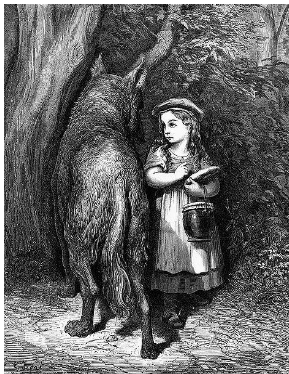
Le Petit chaperon rouge, Gustave Doré.

Très tôt nous apprenons aux filles qu'elles ne sont pas en sécurité dehors. Le petit chaperon rouge est un exemple de comment la culture populaire contribue à développer le sentiment d'insécurité.