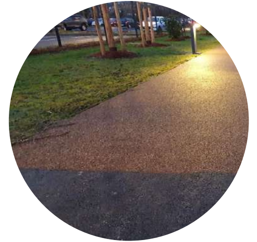
ENROBÉ NOIR HYDRO-LAVÉ