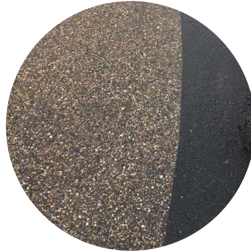
ENROBÉ NOIR HYDRO-LAVÉ