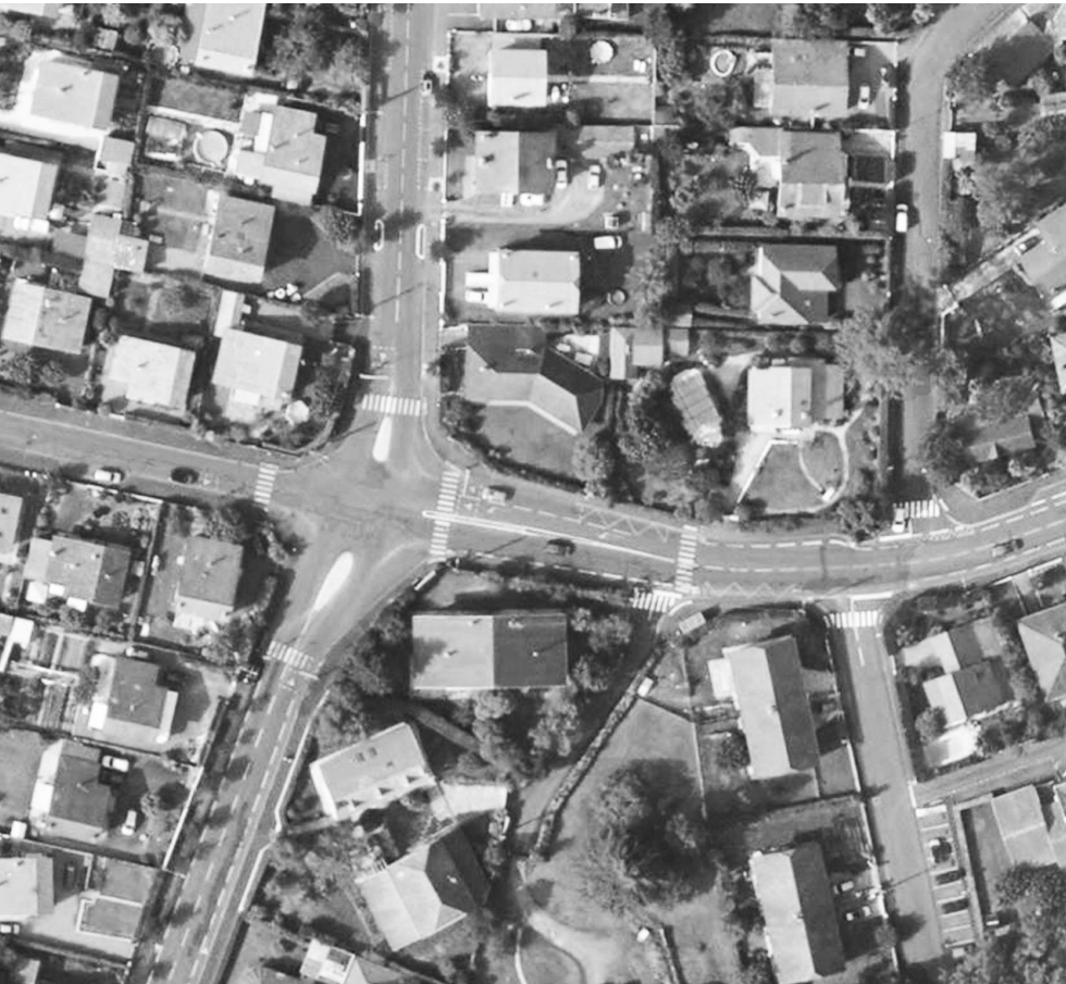
Schéma Directeur des Mobilités Actives Aménagement Carrefour Château d'Este Lalanne